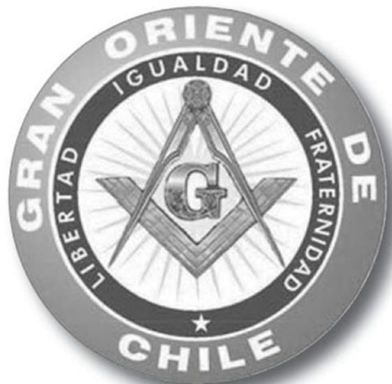
Grand Orient du Chili