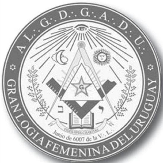
Grande Loge Féminine d'Uruguay