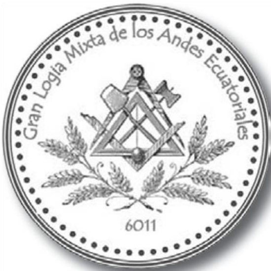
Grande Loge Mixte des Andes Equatoriales